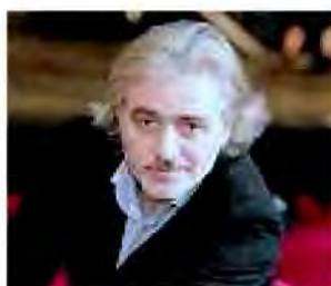
RUGGERO CAPPUCCIO Miglior libro italiano è secondo la giuria il suo "Fuoco su Napoli"