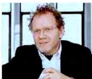
GEORGES DIDI-HUBERMAN "Come le lucciole" è il saggio del filosofo francese premiato dalla giuria