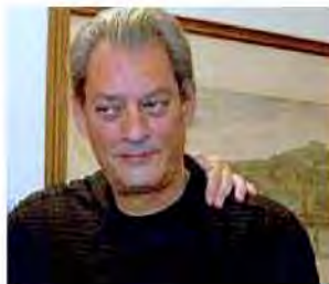
PAUL AUSTER Il romanziere americano premiato per "Sunset Park"