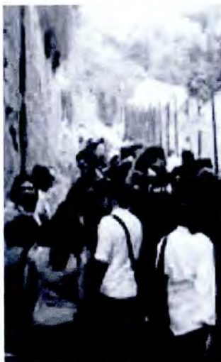
Per le antiche scale Folla al Premio Napoli

Alla fine della salita, una porta che collega direttamente all'Osservatorio, generalmente chiusa, è stata aperta per permettere il passaggio dei visitatori. Varchi che mettono in relazione parti diverse